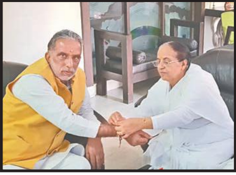
फरीदाबाद से.19-हरियाणा। सोशल जस्टिस एंड वेलफेयर युनियन स्टेट मिनिस्टर कृष्णपाल गुर्जर को रक्षासूत्र बांधते हुए ब्र.कु. हरीश बहन।

आत्मा का जो रिश्ता है, रूहानियत का रिश्ता, वो ज्यादा इम्पोर्टेंट है। लेकिन मैं इसमें ये भी कहना चाहूंगा कि हमारा खून का रिश्ता भी है। हम सबका एक ही खून है, क्योंकि हम सबके माँ बाप जो हैं वो एक ही परमपिता परमात्मा हैं। इसलिए हम लोगों में खून का रिश्ता भी है। और इस खून के रिश्ते में भी हम लोग आपस में जुड़ते जा रहे हैं। ये ऑर्गनाइजेशन जिस तरह से काम कर रहा है बहनों के अपलिफ्टमेंट के लिए, समाज में बुराइयां हटाने के लिए, हमारी अच्छी और हेल्दी लाइफ के लिए ये मेडिटेशन जो कर रहे हैं, वो काबिले तारीफ है। मैंने भी मेडिटेशन किया, जिससे मैंने 10 घंटे की नींद आधे घंटे में पूरी करना सीखा। इतने बड़े ऑर्गनाइजेशन में इतना अच्छा मेंटेनेन्स जहाँ पर आपको कहीं भी मिट्टी नज़र नहीं आयेगी। ये भी काबिले तारीफ है। मैं हर देश में घूमा हूँ, पूरे वर्ल्ड में चक्कर लगाये हैं अपने लीगल वर्क के लिए, लेकिन इतनी सफाई और इतना अच्छा वातावरण मुझे कहीं भी देखने को नहीं मिला। इतने अच्छे लोग विदेश में किसी भी कोने में चले जायें वो नहीं मिलेंगे। मेरी इस ऑर्गनाइजेशन को बहुत बहुत शुभ कामनाएं हैं और मेरा वादा है कि अब मैं बहुत जल्दी जल्दी आता रहूंगा। साल में तीन से चार बार तो जरूर आऊंगा।