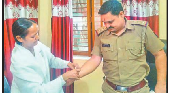
फतेहपुर-उ.प्र.। रक्षाबंधन के पावन पर्व पर थाना अधिकारी को रक्षासूत्र बांधते हुए ब्र.कु. ब्रह्माकुमारी बहन।