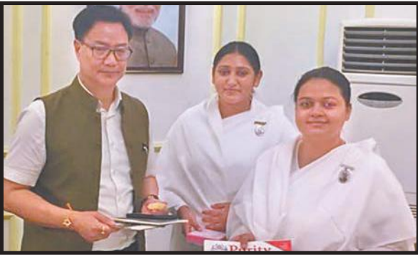
ओ.आर.सी.-गुरुग्राम। गृह राज्यमंत्री किरेन रिजिजू को रक्षासूत्र बांधने के पश्चात् साथ हैं ब्रह्माकुमारी बहनें।

की पोटली सुदामा जी ने हाथ में लिया त्यों ही उन्हें सारा रहस्य मालूम हो गया। सुदामा जी ने सोचा! गुरुमाता ने कहा है कि यह चने दोनों लोग बराबर बाँट के खाना। लेकिन ये चने अगर मैंने त्रिभुवनपति श्री कृष्ण को खिला दिये तो सारी सृष्टि दरिद्र हो जायेगी। नहीं नहीं, मैं ऐसा नहीं करूँगा। मेरे जीवित रहते मेरे प्रभु दरिद्र हो जायें मैं ऐसा कदापि नहीं करूँगा। मैं ये चने स्वयं खा जाऊँगा लेकिन कृष्ण को नहीं खाने दूँगा। और सुदामा जी ने सारे चने खुद खा लिए। दरिद्रता का श्राप सुदामा जी ने स्वयं ले लिया चने खाकर। लेकिन अपने मित्र श्री कृष्ण को एक भी दाना चना नहीं दिया।