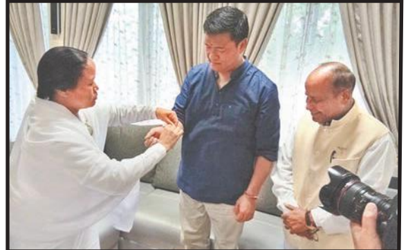
अरुणाचल प्रदेश-ईटानगर। माननीय मुख्यमंत्री पेमा खांडु को रक्षासूत्र बांधते हुए ब्रह्माकुमारी बहन।