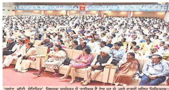
‘माइंड, बॉडी, मेडिसिन’ विषयक सम्मेलन में उपस्थित हैं देश भर से आये हजारों वरिष्ठ चिकित्सक।