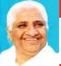
दादी प्रकाशमणि, पूर्व मुख्य प्रशासिका