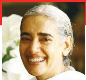
ब.कु. जयंती.यू.के. एंड ओवरसीज कोऑर्डिनेटर

ब्रह्मा बाबा बुजुर्ग थे, फिर भी हम बच्चों को खुश करने के लिए चुस्ती से बैडमिंटन का खेल खेलते थे। खेलते समय बाबा लाइट और माइट हाऊस अनुभव होते थे। बाबा ने मुझसे पूछा कि बच्ची जानती हो किसके साथ खेल रही हो, शिव बाबा के साथ खेल रही हो ना! तो न सिर्फ बाबा ने शब्दों से हमें बताया, बल्कि प्रैक्टिकल हमें अनुभव कराया। ऐसे ही एक बार मैं बाबा के साथ भोजन कर रही थी, बाबा ने मुझे बहुत देर तक दृष्टि दी। तो वायब्रेशन्स से ऐसा लगता था कि हम किसी