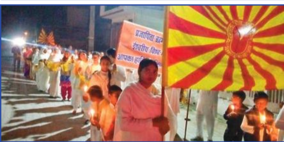
वाजपुर-उत्तराखण्ड। विश्व शांति और सद्भावना के लिए कैडल यात्रा करते हुए भाई-बहनें।