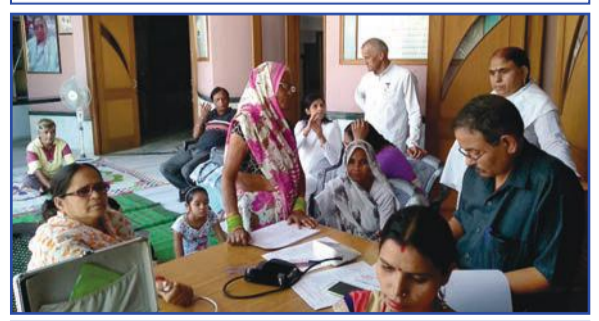
आगरा-उ.प्र.। आर्ट गैलरी म्यूज़ियम पर नि:शुल्क मेडिकल कैम्प लगाया गया। चित्र में कैम्प का लाभ लेते हुए भाई-बहनें।