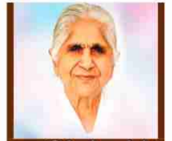
राजयोगिनी दादी जानकी जी

जो स्वदर्शन चक्रधारी ब्राह्मण हैं उन्हें स्मृति रहती हम सो, सो हम... हम सो थे वो अभी हम बन रहे हैं। इस शरीर में होते हुए चेक करो कि ज्ञान में आने से पहले मेरा संकल्प कैसा था? अब कैसा है? वन्दरफुल! रहम, सच्चाई, प्रेम संकल्प में आ गया है। अगर मेरे संकल्प में रहम नहीं है तो वो कोमल दिल है या कठोर दिल है। हमारे दिल में रहम, सच्चाई और प्रेम हो तो संकल्प दृष्टि और कर्म भी ऐसे ही होंगे।